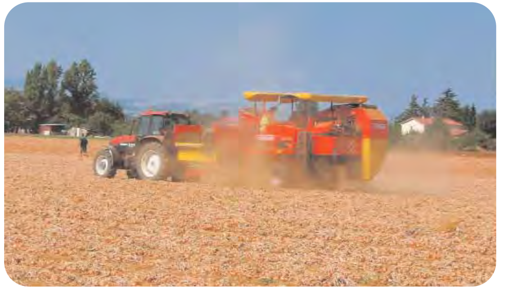
Medicina: la raccolta delle cipolle in un terreno della cooperativa Cometa.

«Mi riferisco soprattutto al mais e alla destinazione a biomassa che se ne fa in pianura padana: lo sviluppo massiccio di questo tipo di impianti sta compromettendo seriamente le colture tipiche del territorio. Purtroppo fino a quando mancherà una regolamentazione seria o prese di posizione che possano garantire un minimo di reddito agli