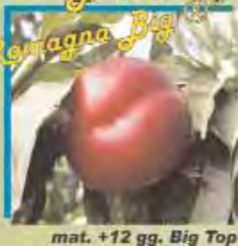
Romagna Big 2 ® mat. +12 gg. Big Top

Inconfondibili per sapore qualità rusticità