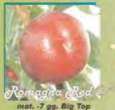
Romagna Red 2 ® mat. -7 gg. Big Top

Inconfondibili per sapore qualità rusticità