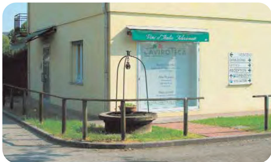
Un particolare della Caviroteca di Faenza, sita in via Convertite, 12 (Tel. 0546 / 629335). L'acquisto di vini di qualità può essere effettuato anche nella Caviroteca di Forlì, in via Due Ponti, 35 (angolo via Zampeschi, tel. 0543/775610) oppure in quella di Savignano sul Panaro (Mo), in via Claudia, 559 (Tel. 059/796746).

La Cagnina Battibecco, anch'essa tipica D.O.C. romagnola, è un vino dolce dai colori violacei e dal profumo caratteristico che allietta le serate autunnali, accompagnando perfettamente dolci e pasticceria secca, crostata, ciambelle e castagne.