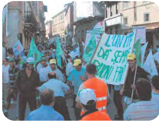
Un cartello per 'l'unità' durante una manifestazione del settore agricolo.