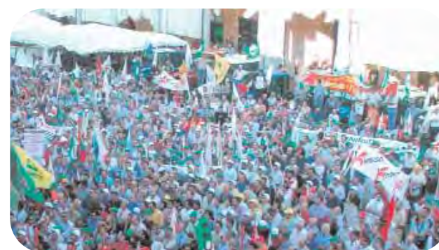
Una manifestazione unitaria dei produttori agricoli del nostro territorio.