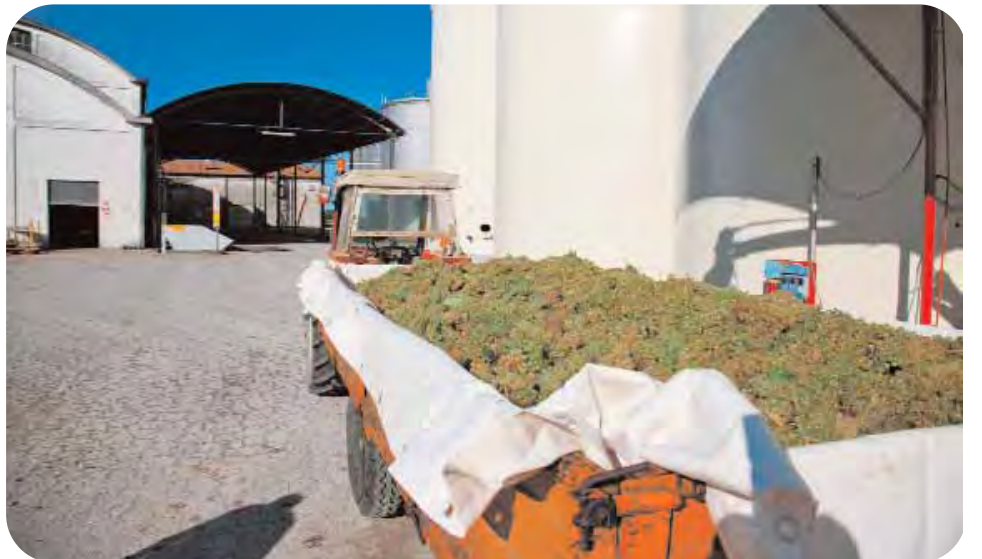
San Pietro in Campiano: il conferimento delle uve dei soci presso le strutture della cooperativa Ville Unite.