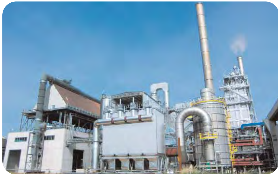
Faenza: una panoramica degli impianti per la produzione di energia nello stabilimento di Caviro.

Il progetto EnercitEE, finanziato dalla Commissione europea, è realizzato nell'ambito del piano energetico della Regione Emilia-Romagna e persegue gli obiettivi 20-20-20 dell'Unione europea: riduzione del 20 per cento delle emissioni di gas serra, produzione del 20 per cento di energia con fonti rinnovabili e riduzione del 20 per cento del consumo energetico.