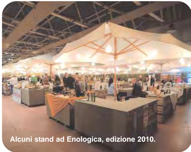
Alcuni stand ad Enologica, edizione 2010.

ed agli operatori. A quest'ultimi Enologica dedica la giornata di lunedì, nell'idea che la filiera debba partecipare complessivamente al processo di specializzazione e di affermazione della qualità.