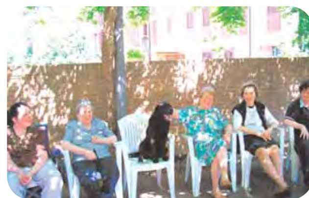
Brisighella, Casa di Riposo 'Istituto Lega': un labrador fa compagnia a delle ospiti della Casa e si presta sereno alle loro cure. Il rapporto uomo/animale fa acquisire maggiore sicurezza di sé.

L'esperienza non è ancora stata conclusa, perciò il discorso resta aperto sul raggiungimento degli obiettivi, ma sicuramente si può affermare che una migliore condizione di benessere degli ospiti si instaura attraverso la presenza ed il contatto con gli animali. È una piccola esperienza, ma può essere un esempio di una rete nel terzo settore tra realtà che operano in campi simili.