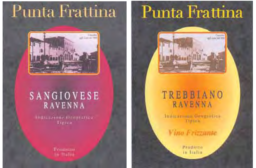
Conselice: il Sangiovese ed il Trebbiano Ravenna sono due delle referenze ad Indicazione Geografica Tipica prodotte nelle cantine della Cooperativa Cesac, con l'etichetta Punta Frattina.

La cooperativa agricola faentina potenzia i propri servizi