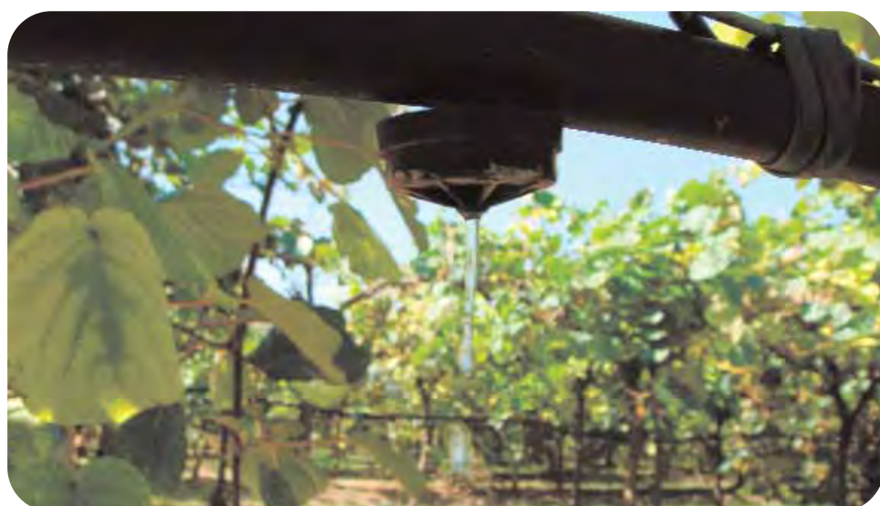
La fertirrigazione, proposta dal Consorzio Agrario di Ravenna, comporta risparmi economici e benefici per l'ambiente.

"Ad esempio conosciamo perfettamente il momento in cui la pianta di actinida (kiwi) ha bisogno di ricevere del calcio, vale a dire nel