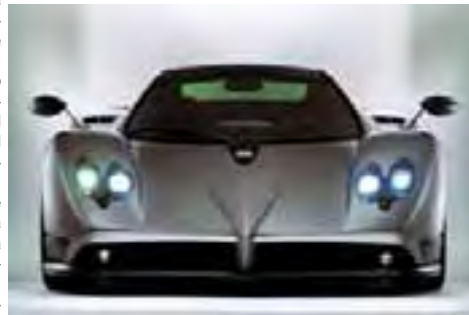
Un'immagine della Zonda, realizzata da Pagani Automobili.

Motore creativo del progetto della Zonda è Horacio Pagani, italo-argentino, che