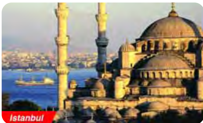
Sopra la nuovissima nave ammiraglia '6 stelle' della MSC 'Magnifica', che porterà i soci Cofra in crociera in Grecia e in Turchia. Sotto, veduta di Istanbul, con in primo piano la Moschea Blu.