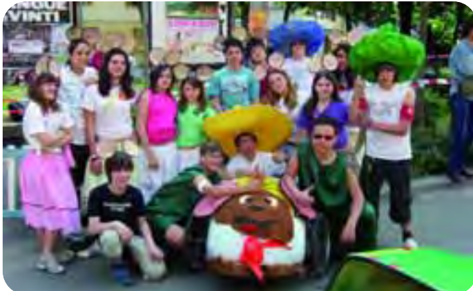
Faenza, 10 maggio 2009. Le squadre vincitrici di categoria nella tappa faentina del campionato europeo delle VaP. Qui sopra l'équipe della Scuola Media Cova-Lanzoni in posa attorno alla velocissima 'Speedy Gonzales', in alto quella dell'ITIP 'Bucci' che ha partecipato con 'Volante della Polizia'.