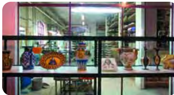
Imola: una veduta del Museo insediato nello storico stabilimento della Cooperativa Ceramica d'Imola, ora ristrutturato e reso accessibile al pubblico.