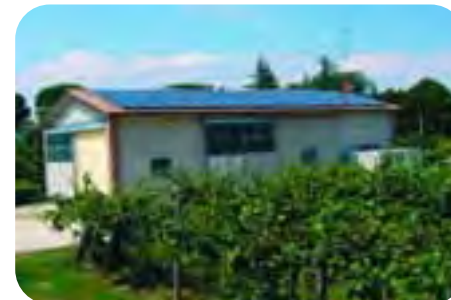
Sarna (Faenza): L'impianto fotovoltaico da 13 kw installato da Cofra Energy nella proprietà dell'Az. Agr. Domenico Frega.