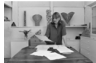
L'artista svizzera Petra Weiss nel suo studio.

personale ed ha ottenuto prestigiosi riconoscimenti a livello internazionale. Mostre sul suo lavoro sono state infatti organizzate in Europa, in Giappone, in Canada e negli Stati Uniti.