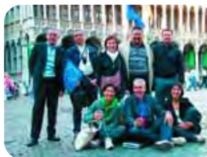
Bruxelles, giugno: la delegazione di cooperatori sociali in piazza nella capitale belga (serv. a pag. 24)