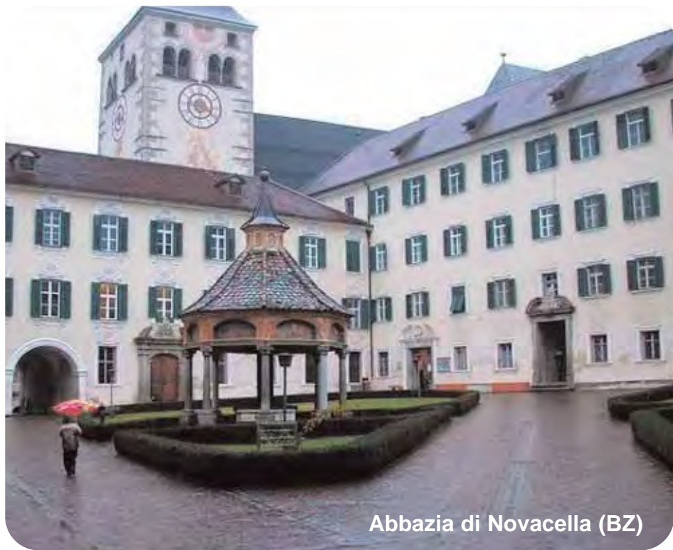
Abbazia di Novacella (BZ)