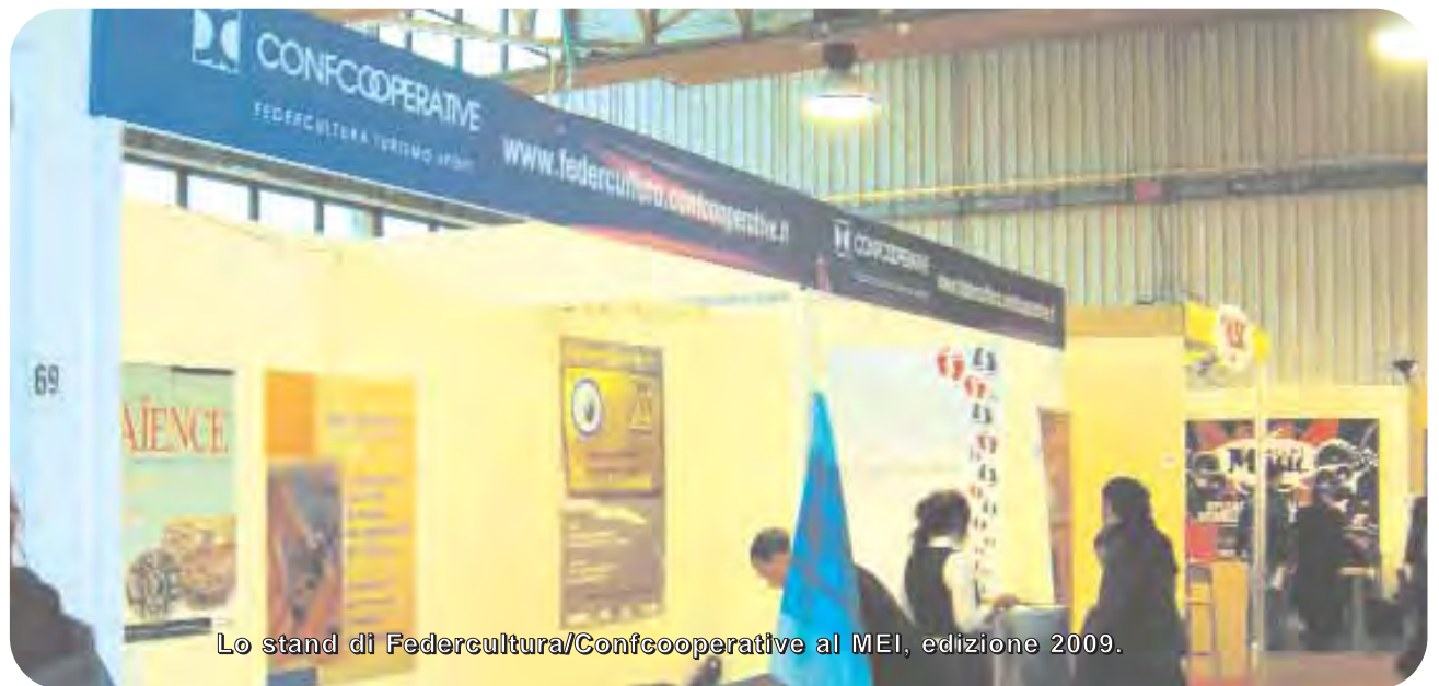
Lo stand di Federcultura/Confcooperative al MEI, edizione 2009.