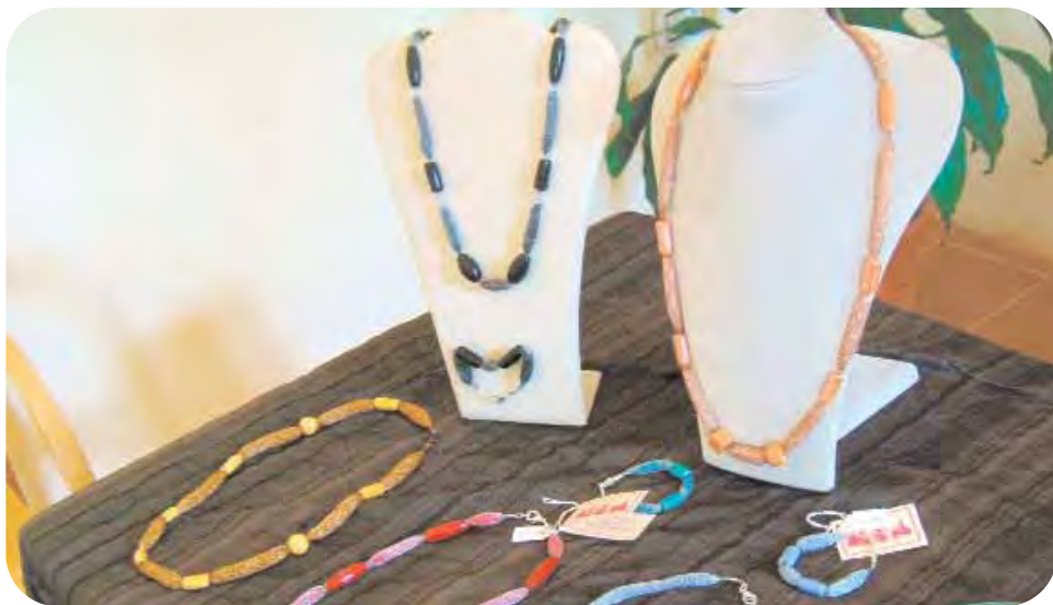
Un particolare della 'Mostra delle cooperative sociali' che si è tenuta recentemente nell'Ostello di Bagnacavallo.

giro d'affari del mercato del turismo e tempo libero.