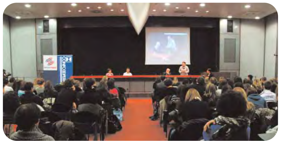
Bologna, 26 ottobre: studenti bolognesi durante il convegno per il lancio del concorso che prevede l'invenzione della miglior cooperativa innovativa.

Otto gli Istituti in concorso quest'anno, per un totale di circa 200 ragazzi e ragazze di terza e quarta superiore. Le classi avranno una cooperativa che farà da testimonial, come Emil Banca, il