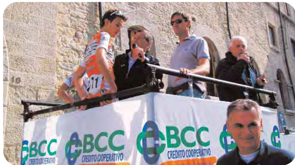
S. Marino: un momento della premiazione del vincitore della avvincente corsa che da Lugo ha portato nell'antica repubblica. Tra gli sponsor il Credito Cooperativo ravennate e imolese.