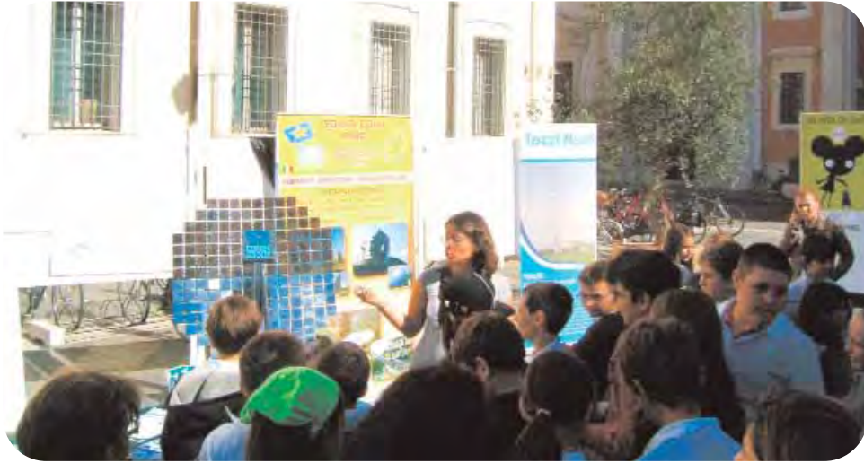
Durante la recente manifestazione Ravenna 2010, esperti della cooperativa Impronte illustrano agli alunni in visita all'esposizione in piazza del Popolo alcuni esempi di tecnologie rinnovabili.

cooperativa in onda il sabato sera su Teleromagna) al tema dell'energia alternativa da fonti rinnovabili esaminandone approfonditamente disciplina giuridica e aspetti economici e sociali.