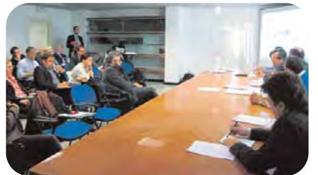
Ravenna, 12 ottobre: un momento della tavola rotonda sul tema dei trasporti a corto raggio.