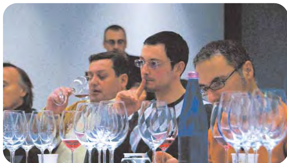
Un momento delle degustazioni nel corso di Enologica 2009.

Caravanserraglio , spazio culturale sarà il luogo di incontro, di scambio e di confronto, un salotto per esperienze uniche ed originali, al quale parteciperanno alcuni tra i principali giornalisti, enologi, esperti di vino a livello nazionale ed ospiti internazionali. Non solo cibo e vino, quindi, ma eventi, curiosità gastronomiche, libri, racconti, interviste, con-