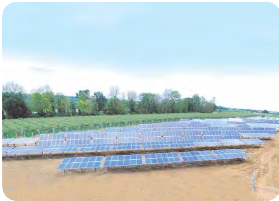
Esempio di orto fotovoltaico realizzato da CofraEnergy del Gruppo Cofra.