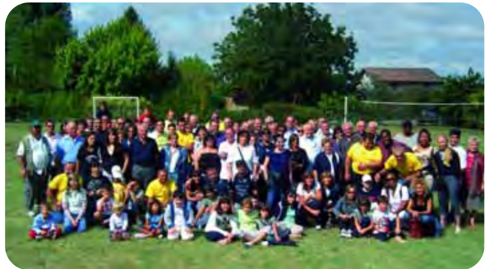
Casa del Tempo Libero della CMCF in via Gradasso al Ponte del Castello, domenica 14 settembre. Foto di gruppo dei partecipanti alla festa annuale della cooperativa faentina. Al tradizionale appuntamento, che si ripete da oltre vent'anni la seconda domenica di settembre, prendono parte i soci lavoratori, i dipendenti, i pensionati e le loro famiglie. Dopo il pranzo a mezzogiorno, pomeriggio dedicato ai bambini con giochi ed attività varie organizzate dalla cooperativa Kaleidos.