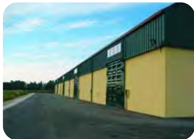
Consorzio Agrario di Ravenna: il magazzino di stoccaggio cereali di S. Pietro in Campiano.

«Tutti sappiamo quello che sta accadendo negli ultimi tempi, con la difficoltà delle famiglie a sopportare il rincaro di generi alimentari di primaria necessità, come il pane e la pasta; ma i produttori non si stancano di ricor-