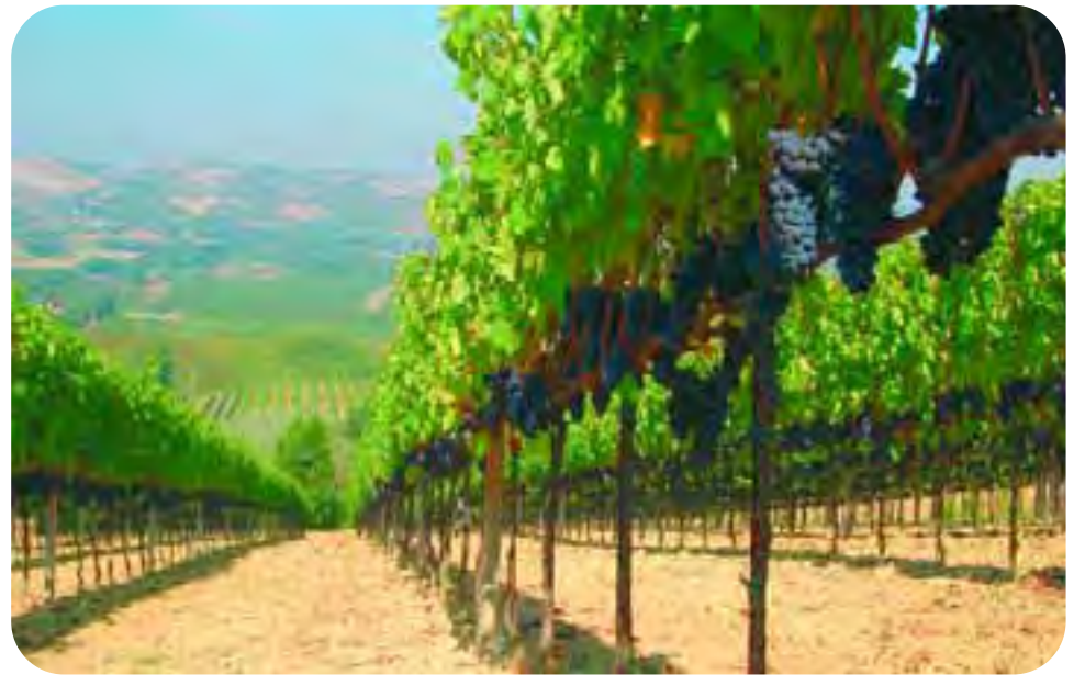
Un bellissimo filare di sangiovese delle nostre colline romagnole. Con la modifica dei disciplinari, il Sangiovese di Romagna avrà nuove regole per fregiarsi della specificazione aggiuntiva 'Riserva'.

Per salvaguardare i territori delle Denominazioni di Origine serve quindi puntare più sul territorio. È per questo che attualmente è in discussione nel Consorzio Vini di Romagna la possibilità di un nuovo disciplinare che raggruppi gli attuali vini DOC, sotto una nuova denominazione «Romagna», che permetta poi di indicare il vitigno e, come nel caso di una tipologia del Sangiovese, di poter riportare anche le menzioni geo-