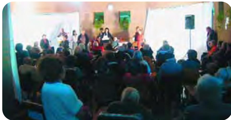
Ravenna, Casa Protetta Galla Placidia, gestita dalla cooperativa sociale Asscor (Sol.co): un momento di uno spettacolo organizzato per gli ospiti. I 2/3 delle cooperative sociali operanti nel settore aderiscono a Confcooperative Ravenna.

per la qualità della vita percepita e per le tutele offerte dal modello di welfare.