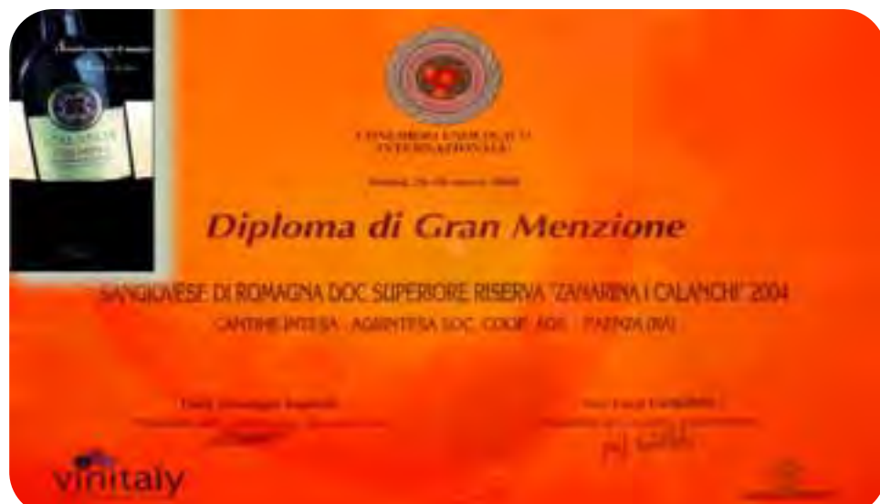
Il diploma di Gran Menzione assegnato nel corso dell'ultimo Vinitaly al Sangiovese di Romagna DOC Superiore Riserva 'Zanarina I Calanchi' 2004.

Nei supplementi al numero di ottobre 2008 di 'In Piazza', Unione Notizie affronterà in modo specifico argomenti di carattere fiscale, economico, previdenziale e del credito.