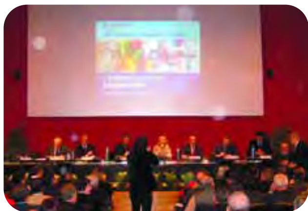
Ravenna: un'immagine dell'ultima Assemblée Provinciale di Confcooperative (gennaio 2008). Il tema - guida era: 'I valori dell'impresa cooperativa'.

Un grande Concorso fotografico sul mondo della cooperazione: è questa la prima iniziativa che Confcooperative Ravenna propone alla base sociale, in occasione del prossimo 60° dalla sua nascita.