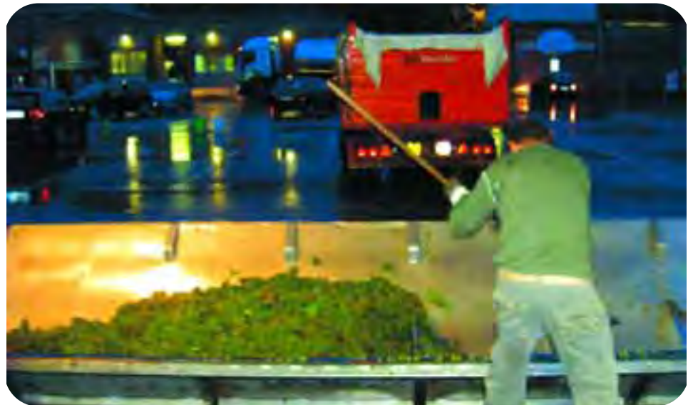
Conselice, Cantina sociale: una fase delle attività di conferimento delle uve da parte dei soci. Si prevede un'annata da ricordare per la qualità.

Ottant'anni di esperienza al servizio dei nostri clienti