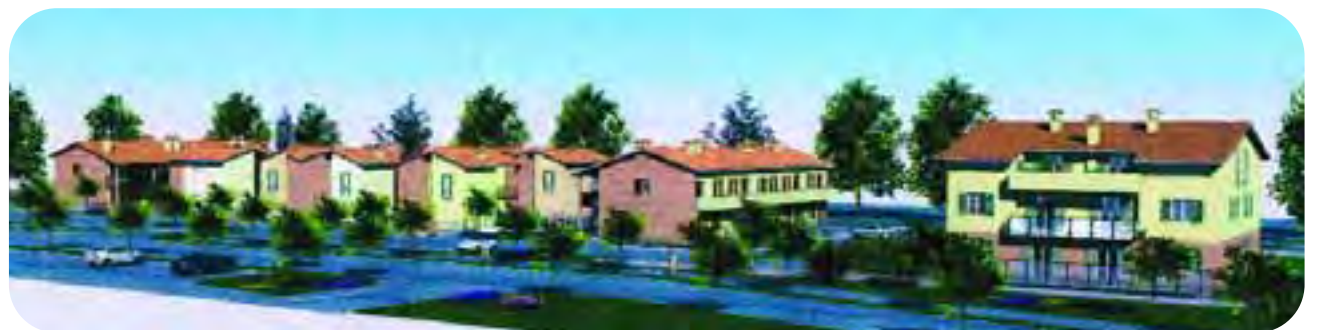
Faenza: rendering del complesso residenziale, composto da cinque distinti fabbricati, che sorgerà nel quartiere San Rocco a cura della C.M.C.A. di Cotignola.

«Era per noi doveroso - ha ricordato il presidente nazionale dell'Anspi - in occasione dell'Anno Paulino, rivolgere una particolare attenzione all'Apostolo delle Genti, figura di riferimento della nostra associazione. L'Anspi, come si sa, è al servizio delle comunità parrocchiali, creando accoglienza, amicizia, evangelizzando attraverso la gioia della fede, dando importanza ai giovani attraverso lo sport, il teatro, la musica, il turismo e la ricreazione.»