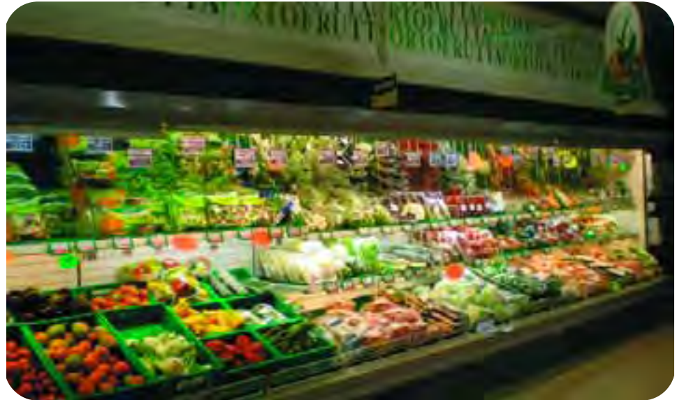
Bagnacavallo: il reparto ortofrutta del supermercato Conad Cobar del Centro Commerciale 'La Pieve'.

la banana, non contiene amido ma apporta zuccheri