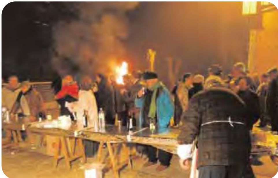
Conselice, Punta Frattina: brucia nella piazza il vecchio del 2008 ed i soci festeggiano insieme ai loro familiari e si riscaldano con piadina, salsiccia e vino offerto dalle cooperative conselicesi.

«È un 2009 importante per i soci delle cooperative di Conselice dopo un 2008 difficile ma che ha visto l'importante novità della fusione tra Cesac e Cooperativa Coltivatori Diretti. Un dato importante per le nostre attività e per tutti quelli coinvolti.»