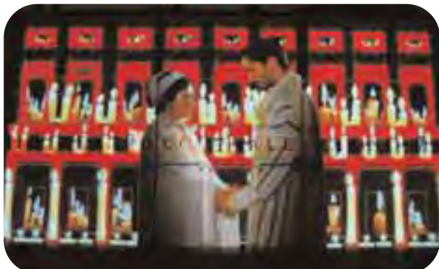
Faenza, piazza Nenni, prospettiva del Teatro Masini: una delle scene più commoventi dello spettacolo 'Natività' che è stato proiettato sulla facciata del Teatro Masini tutte le sere, dalle 18 alle 24, dalla vigilia di Natale alla sera dell'Epifania. Lo spettacolo è stato reso possibile anche grazie al contributo di Confcooperative Ravenna e delle associate BCC ravennate e imolese, Agrintesa, Caviro, Cofra, Cmcf, Gemos, In Cammino, Servizi Ecologici, Coop. Agr. S. Biagio.

Il 9 dicembre, al Teatro Rossini di Lugo, i rappresentanti della cooperazione sociale e delle istituzioni della provincia di Ravenna si sono riuniti per dare nuovo impulso al dibattito iniziato circa un anno fa a Faenza, quando erano stati aperti i lavori del "Cantiere del Welfare".