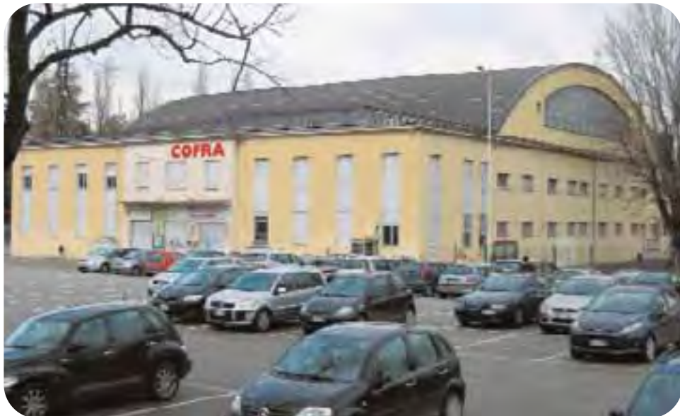
Faenza: il piazzale Pancrazi con il Palacofra (ex Palabubani) sullo sfondo. La struttura è gestita dalla cooperativa Nuova Co. Gi. Sport, che ha trovato nella Cofra lo sponsor ideale per il nuovo nome del Palazzetto.

risparmio alla sua base sociale e con il nuovo record di oltre 24.000 soci sceglie con PALACOFRA di essere vicina al territorio, alla vita sportiva, alla città. Auguro al Palacofra un ottimo 2009!» Paola Casta