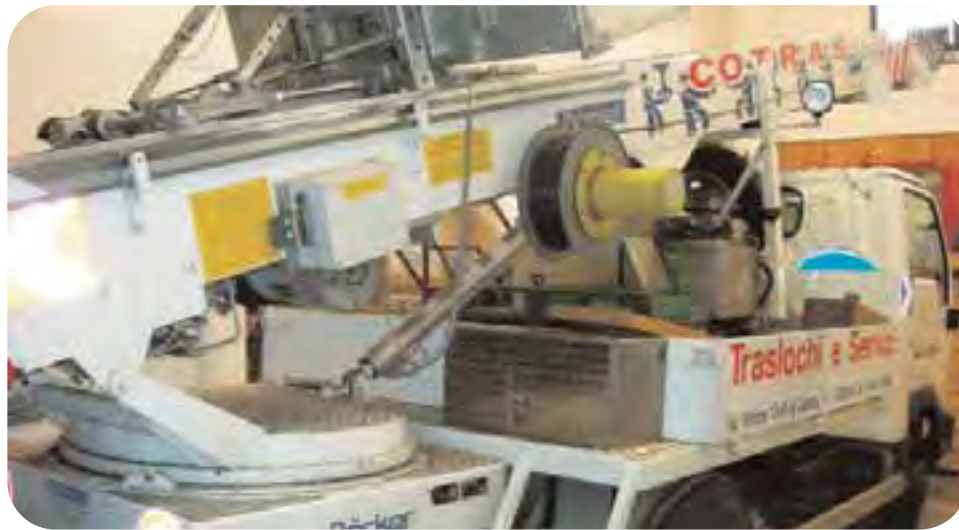
Faenza, sede Cotras, via Vittime Civili di Guerra 11: un automezzo della cooperativa attrezzato per il servizio traslochi, una delle attività specialistiche su cui punta la cooperativa nel medio termine.

In una recente assemblea generale, i soci hanno dato il loro assenso alla fusione fra le due cooperative Cotras e CoServizi.