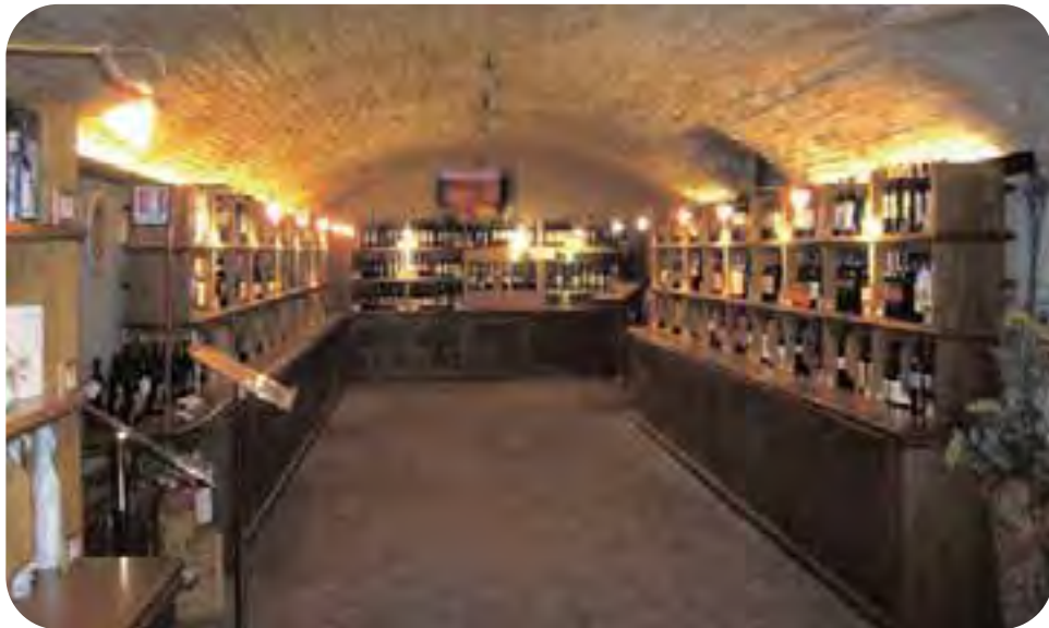
Dozza. Un'immagine dell'Enoteca Regionale Emilia Romagna, l'ente per la promozione e la valorizzazione dei vini della nostra regione, che costituisce un punto di osservazione privilegiato sull'andamento della commercializzazione vinicola.

potere d'acquisto, in parte reale ed in parte percepito dal consumatore come di molto superiore al livello ufficiale dell'inflazione. Si sa che nei consumatori, a parità di disponibilità economico-finanziaria, quello che conta è la fiducia e quella oggi sta venendo meno; se poi si aggiunge una diminuzione reale del potere d'acquisto si rischia di entrare in un serio periodo di recessione.