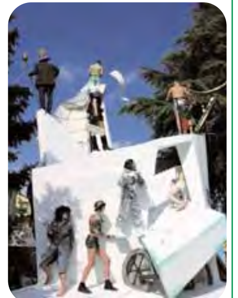
Casola Valsenio. Uno dei cosiddetti 'carri in gesso di pensiero', la cui sfilata caratterizza la Festa di Primavera.