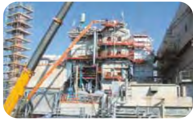
Rimini: Centrale termica per trattamento rifiuti presso Coriano (RN).

«Abbiamo delle commesse e delle prospettive di lavoro anche per il prossimo biennio: questo fattore ci permetterà di affrontare i prossimi