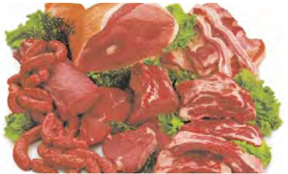
Un'immagine di prodotti del Gran Suino Padano da cui è tratta la prima carne suina DOP d'Italia. A sinistra alcuni esempi della campagna pubblicitaria apparsa recentemente sulla stampa italiana, in quotidiani e periodici tra i più diffusi.

«I nostri allevamenti e quelli dei nostri soci sono inseriti in un circuito costantemente controllato sia dalla nostra cooperativa, sia da enti terzi che verificano il rispetto delle regole. Sistemi informatici tecnologicamente avanzati garantiscono