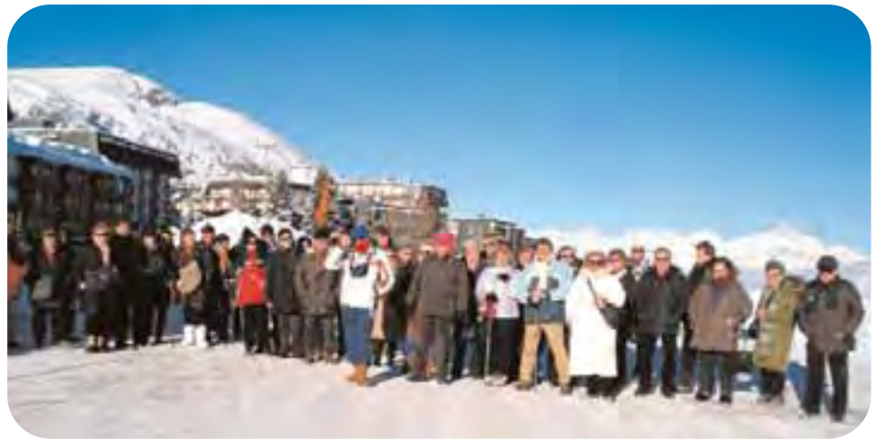
Sestriere: un gruppo di soci della 'Stella' durante un soggiorno invernale nella famosa località montana.