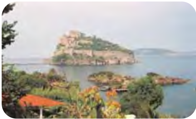
Ischia, il Castello Aragonese: forte interesse dei soci per i soggiorni primaverili e autunnali nell'isola.