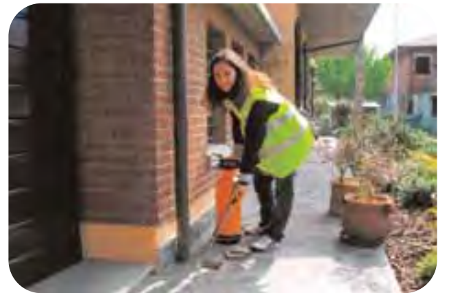
Ravenna, estate 2008: un'attività di disinfestazione dalla zanzara tigre in area privata attuata da 'La Pieve'.

«In base all'accordo che abbiamo stipulato col Comune