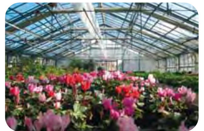
Festa di colori in una delle strutture produttive del Centro occupazionale 'La Serra' di In Cammino.

Questo deve il suo nome alle serre situate all'esterno, dove vengono prodotte diverse piante destinate al commercio. I ragazzi colla-