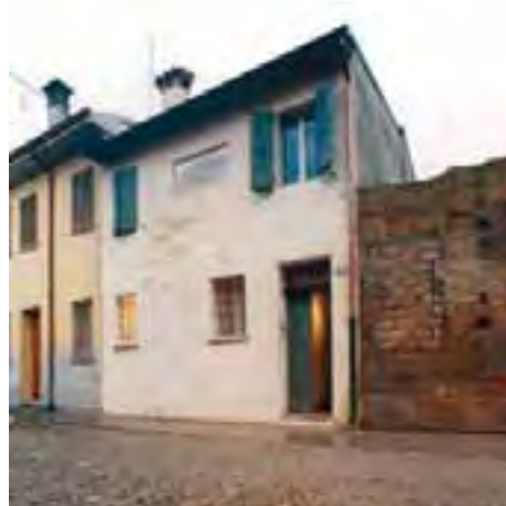
Lugo. La casa Rossini in Via Rocca

pe e Luigi avevano fondato la scuola di musica frequentata dallo stesso Rossini nei suoi anni lughesi.