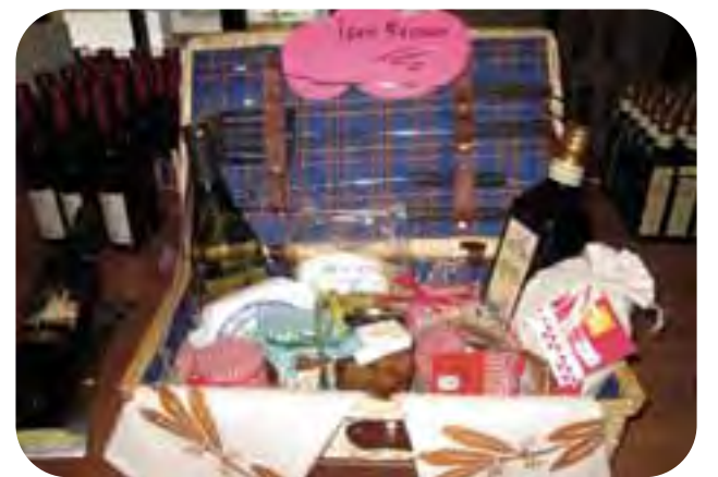
Brisighella: assaggio di olio 'buono' e un'idea regalo presso l'outlet 'Terra di Brisighella', in via Strada 2.