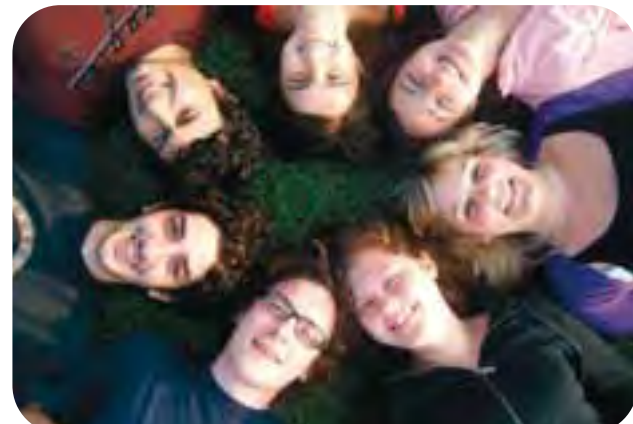
Mediante i programmi Gioventù in Azione e Leonardo da Vinci la cooperativa Kara Bobowski ha ospitato 520 giovani provenienti da vari Paesi europei e ne ha inviato all'estero oltre 490.

Le finalità alla base di ogni progetto intrapreso sono gli stessi principi che hanno ispirato la nascita della cooperativa: prendersi cura delle persone più deboli del proprio territorio; dare