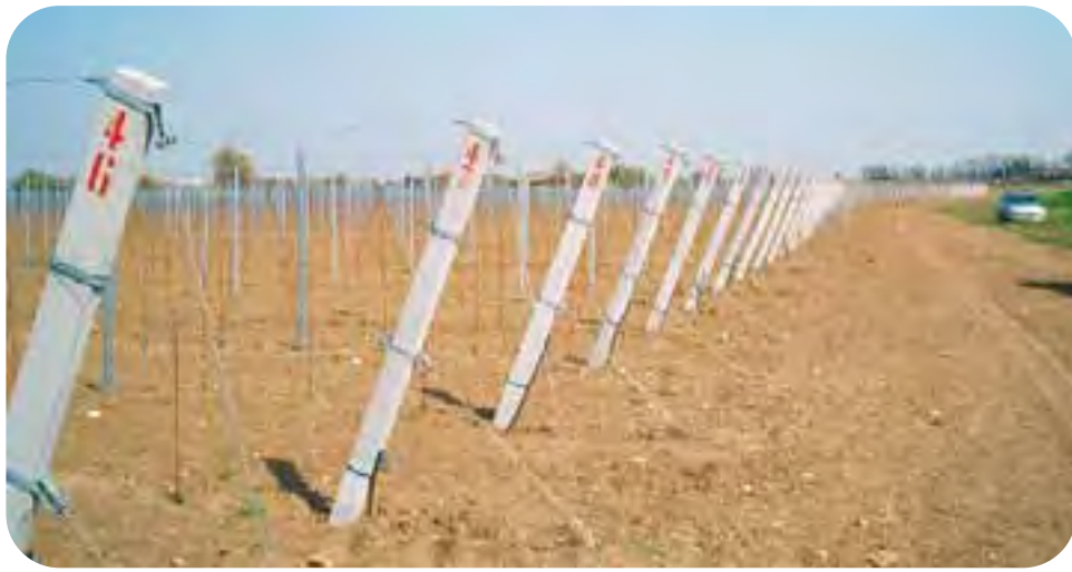
Bassa pianura romagnola: un moderno impianto viticolo di Idrologica, studiato in base a precisi parametri tecnici e predisposto per la meccanizzazione.

(Ulteriori approfondimenti sull'argomento nei prossimi numeri di In Piazza)