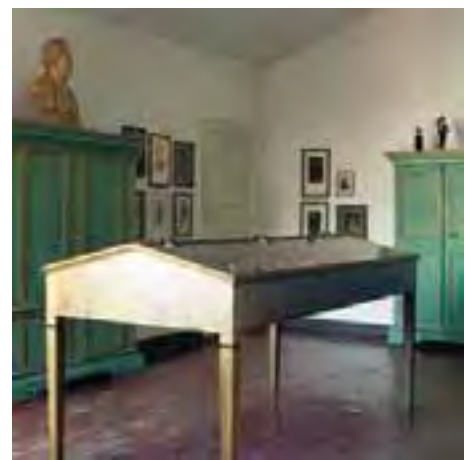
Bagnara di Romagna. Un interno del Museo Pietro Mascagni