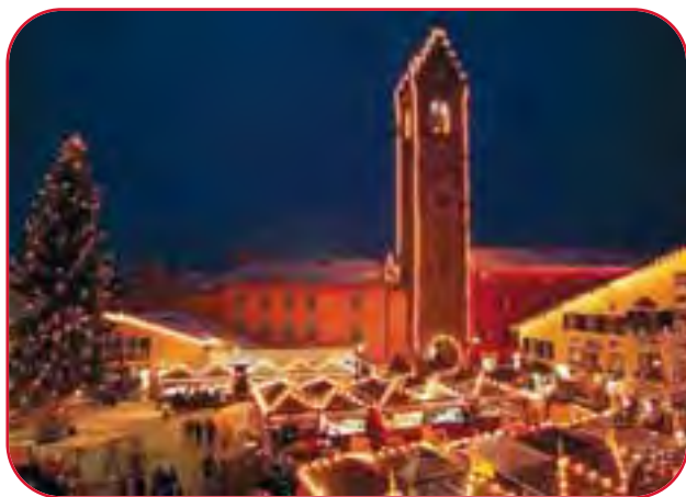
Vipiteno: il Mercatino di Natale ai piedi della Torre delle Dodici

sapori tipici. Casette di legno per esporre merce tradizionale, idee regalo, cibi locali, vin brulé, dolci.