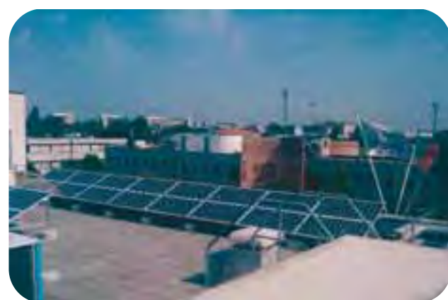
Dopo Lugo, intervento fotovoltaico alla nuova sede di Confartigianato a Ravenna: IMPIANTO FTV 20 KWp parzialmente integrato, impianto "chiavi in mano".

Confartigianato ha scelto il fotovoltaico e la convenienza; con questo impianto con-