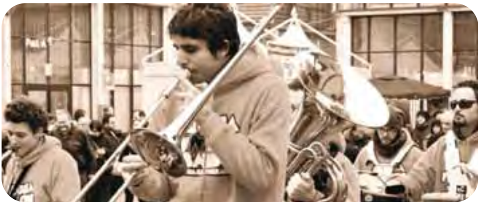
Faenza. Atteso da un anno all'altro da una marea di addetti ai lavori, il Meeting delle Etichette Indipendenti 2009 ha visto la presenza del ministro delle Politiche Giovanili Giorgia Meloni (in alto) e di numerosi solisti e formazioni musicali (in basso, la P. Funking Band ).