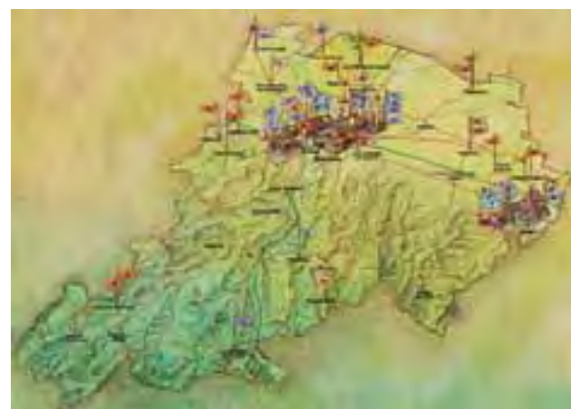
In questa mappa della provincia di Bologna le bandierine indicano le sedi delle coop. di Confcooperative individuate.

In altri settori ci sono realtà che valorizzano l'artigianato artistico o il recupero degli antichi mestieri. Alcune cooperative hanno poi sedi di interesse storico e artisti-