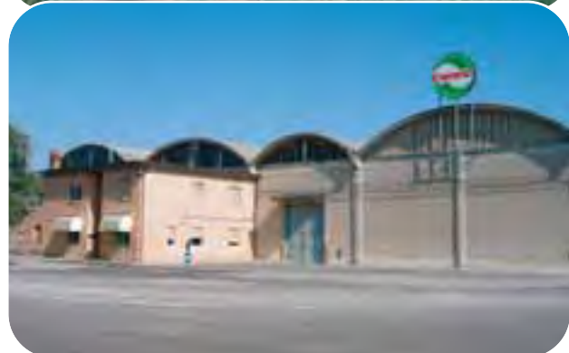
Medicina: la sede della cooperativa Cometa, specializzata nella produzione di patate DOP e cipolle IGP. Sopra: una moderna coltivazione di cipolle.