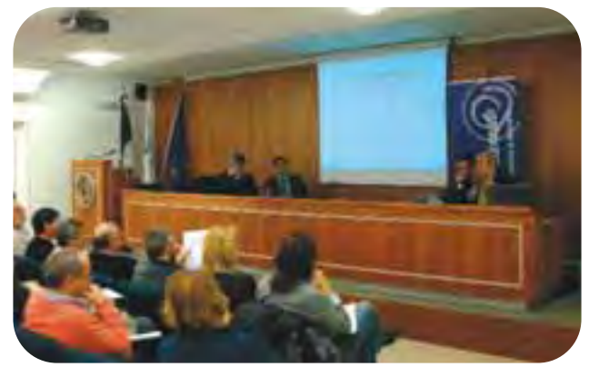
Ravenna, 13 novembre, sede di Confartigianato. La serata di studio organizzata congiuntamente da Confcooperative e Confartigianato per spiegare i riferimenti contrattuali della nuova normativa in materia di trasporto.